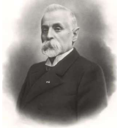
Comm. TOMASO AMBROSETTI GRANDE UFFICIALE DELLA CORONA D'ITALIA INSIGNE BENEFATTORE DI QUESTO OSPEDALE

Il primo insigne Benefattore Fondatore è il Grand'Ufficiale Tomaso Ambrosetti nato a Morbegno il 04 giugno 1834 e morto a Buenos Aires (Argentina) il 06 maggio 1926, che migrante fece fortuna in Argentina e nei primi anni del '900 inviò generose donazioni alla Città di Morbegno per la realizzazione di numerose opere fra cui la "Casa di Ricovero" per anziani.